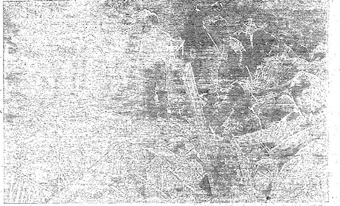
بين الانقاض راح السكان يبحثون عن اقاربهم واشيائهم ... انها مأساة الضحية المعاني الذي يفقو والبربرية الاسرائيلية ترتكب جرائمها في جنح الظلام